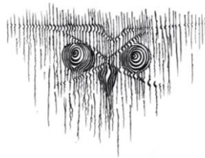
Joonis 1. Rakvere Realgümnaasiumi logo.

NB! Joonised ei tohi asuda tekstide kõrval.